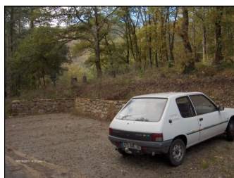
Le Bruel : parking