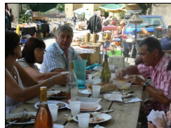
Repas des producteurs été 2011