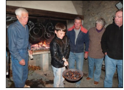
Brasucade à Serres