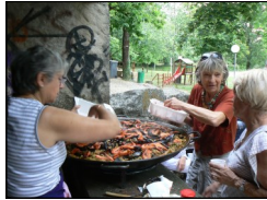
Paëlla Club Lou Rossignol