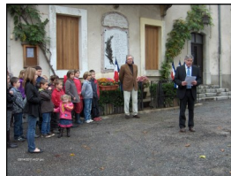
Cérémonie du 11 novembre 2011