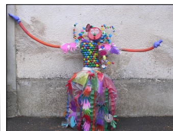
Lauréat du Concours de la Main verte