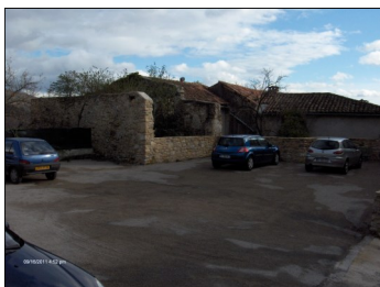
La Placette : parking

Après démolition de ruines puis amélioration des murs ceinturant le secteur communal, nous disposons, enfin, d'une belle ouverture sur la Vallée et d'une placette multipliant les places de stationnement pour les riverains.