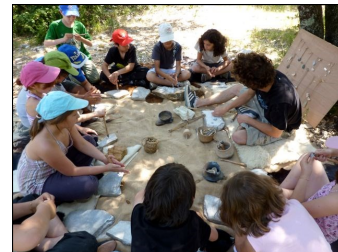
Sortie à Cambous Site préhistorique Mai 2011