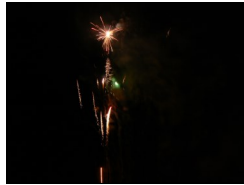
Feu d'artifice décembre 2010