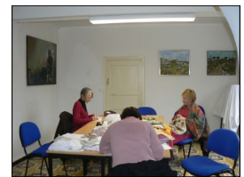
Association A quatre Mains