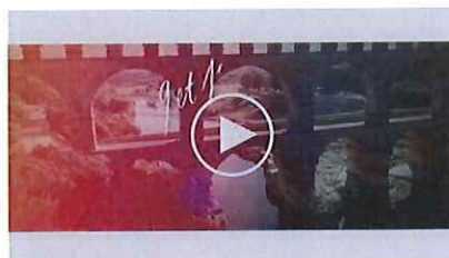
Le clip de lancement de Lives au Pont 2015