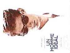
Un homme idéal