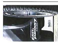
Fast & Furious