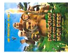
Pourquoi j'ai pas mangé mon père