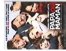
Papa ou Maman