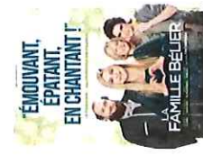
La Famille Bélier