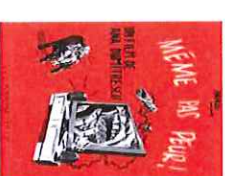
Même pas peur