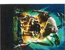
Chair de Poule