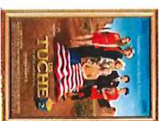
Les Tuche 2