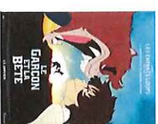
Le garçon et la bête