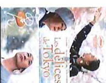
Les Délices de Tokyo