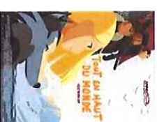
Tout en haut du monde