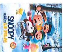
Snoopy et les Peanuts