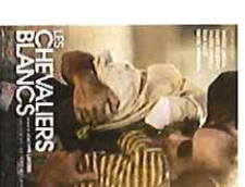
Les chevaliers blancs